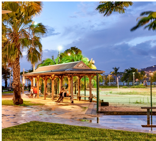
L'Esplanade des Arawaks

Dès les années 1960, la ville de Schoelcher s'embellit d'œuvres d'artistes martiniquais. On peut voir de nombreuses fresques et statues.