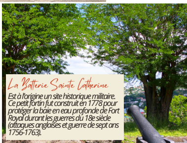
La Batterie Sainte Catherine

Anciennement nommée Anse Case-Navire, elle est située à quelques minutes à pied du centre-ville, non loin de la place principale de l'église.