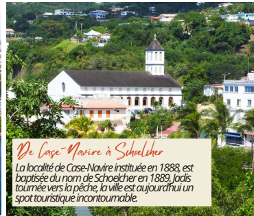
De Case-Navire à Schoelcher

Son littoral exceptionnel borde la mer Caraïbe de Fond Lahaye à la Batelière. Son mouillage côté côte sous le vent, est réputé. Son centre nautique est labellisé Station Nautique.