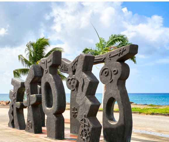
«Les Arbres de La Liberté» - H. Quélon, 2001

Circuit guidé proposé par l'Office de Tourisme Centre Martinique