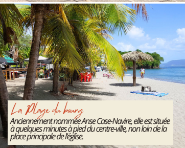
La Plage du bourg

Son nom fait écho aux implantations amérindiennes qui furent très tôt attestées à l'embouchure de la rivière Case-Navire.